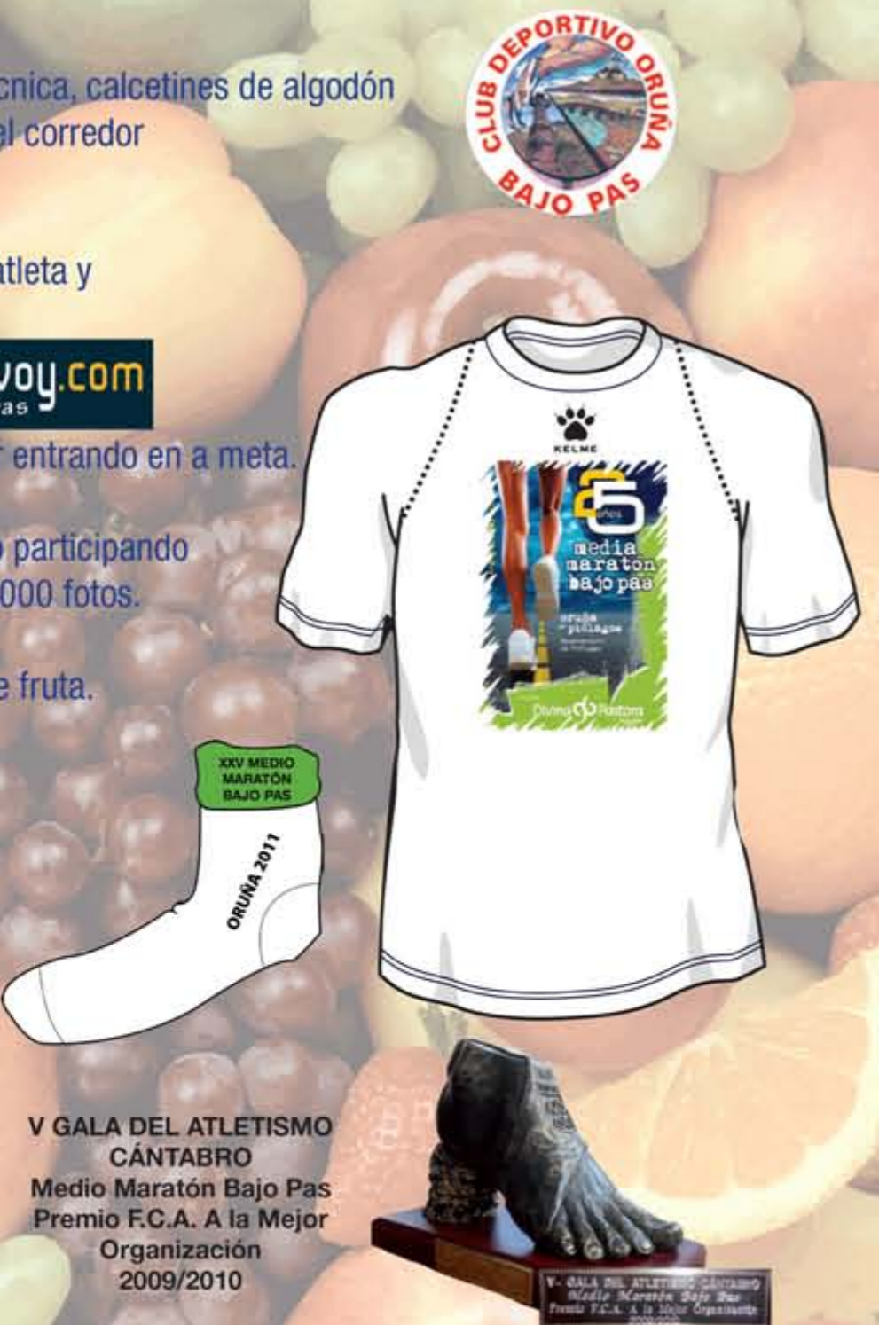
V GALA DEL ATLETISMO CÁNTABRO Medio Maratón Bajo Pas Premio F.C.A. A la Mejor Organización 2009/2010

Esta prueba la hacéis grande vosotros, los atletas. ¡Haz llegar información a otros posibles participantes!